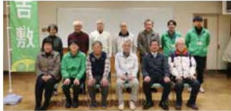
吉敷地区広報委員会

今回の受賞を励みとして、新しいコーナーの設置に取り組み、住民の皆さんに心待ちにしていただけのような魅力ある広報紙の発行に引き続き、取り組んでいくことにしています。