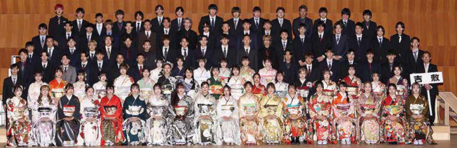
二十歳を迎えたみなさん、おめでとうございます! ～令和7年山口市二十歳のつどい～