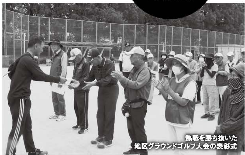
熊鷹を勝ち抜いた 地区グラウンドゴルフ大会の表彰式