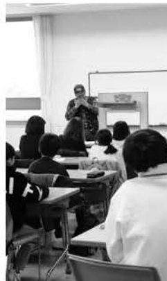
紙芝居を披露する様子

YKB会では、学習支援を行うだけでなく、紙芝居や、地域交流センター定期利用団体による発表鑑賞も行っています。地域と学校が連携し、学習支援だけではなくとどまらない工夫を行っています。