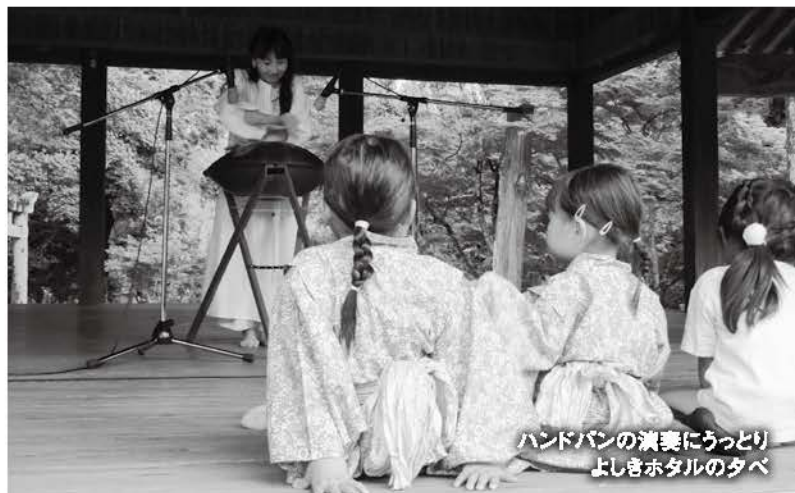
ハンドパンの演奏にうっとり よしきホテルの夕べ