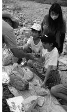
昨年の「石図鑑を作る」の様子

古文書講座は、毎月第4月曜日に地域交流センターにおいて開催しており、随時参加者を募集しています。