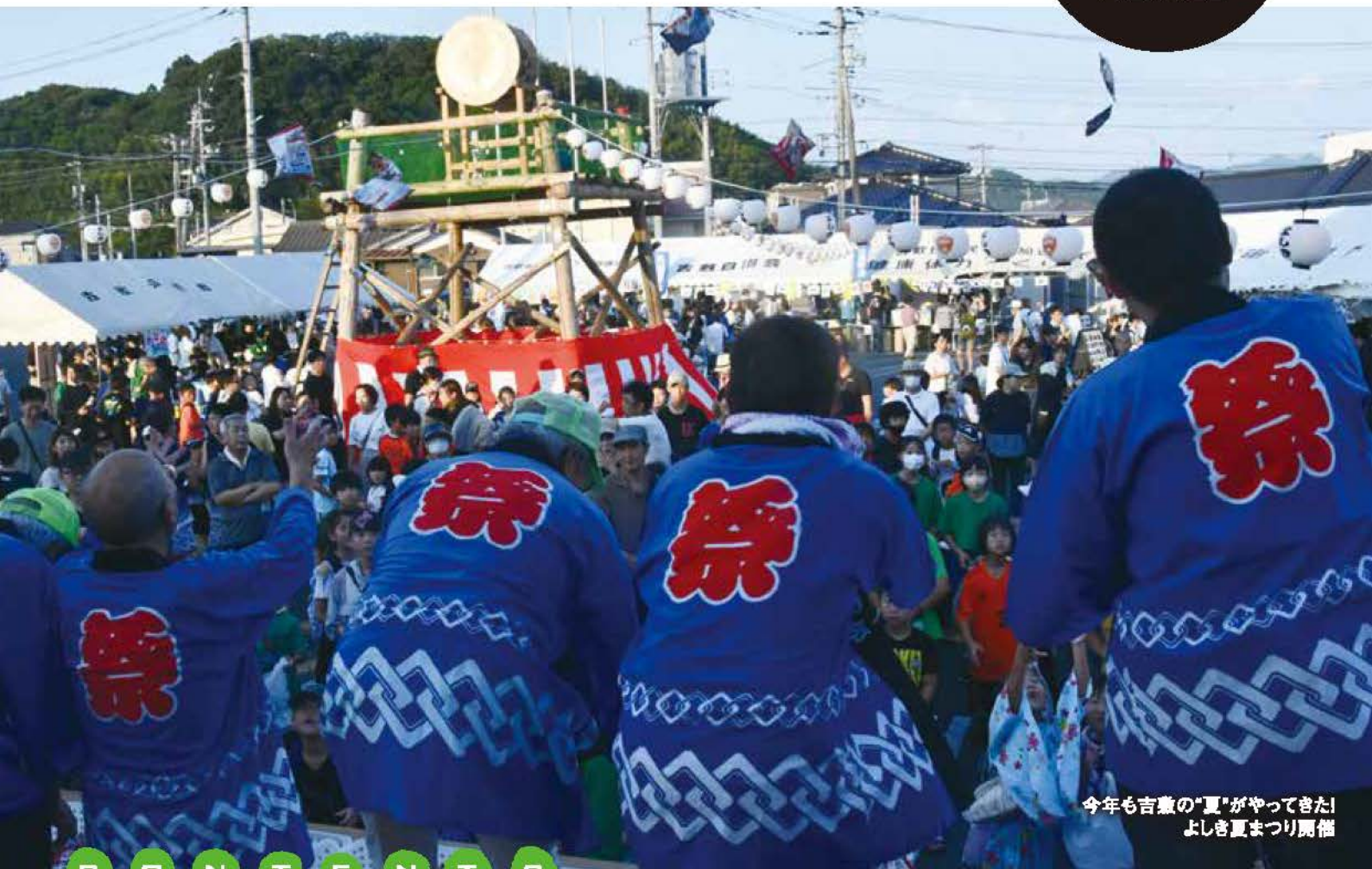
今年も吉敷の“夏”がやってきた！ よしき夏まつり開催