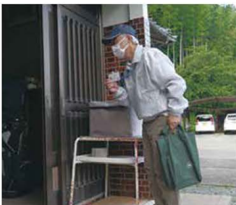
写真は訪問イメージです!!

夏季を除き、背中に吉敷地区民生委員・児童委員協議会の文字の入ったグレーのジャンパー姿で、写真のように「身分証」を提示して、活動しています。どうぞお気軽にお声をかけてください。