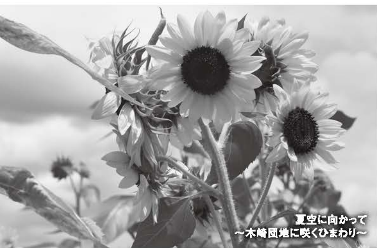
夏空に向かって ～木崎団地に咲くひまわり～