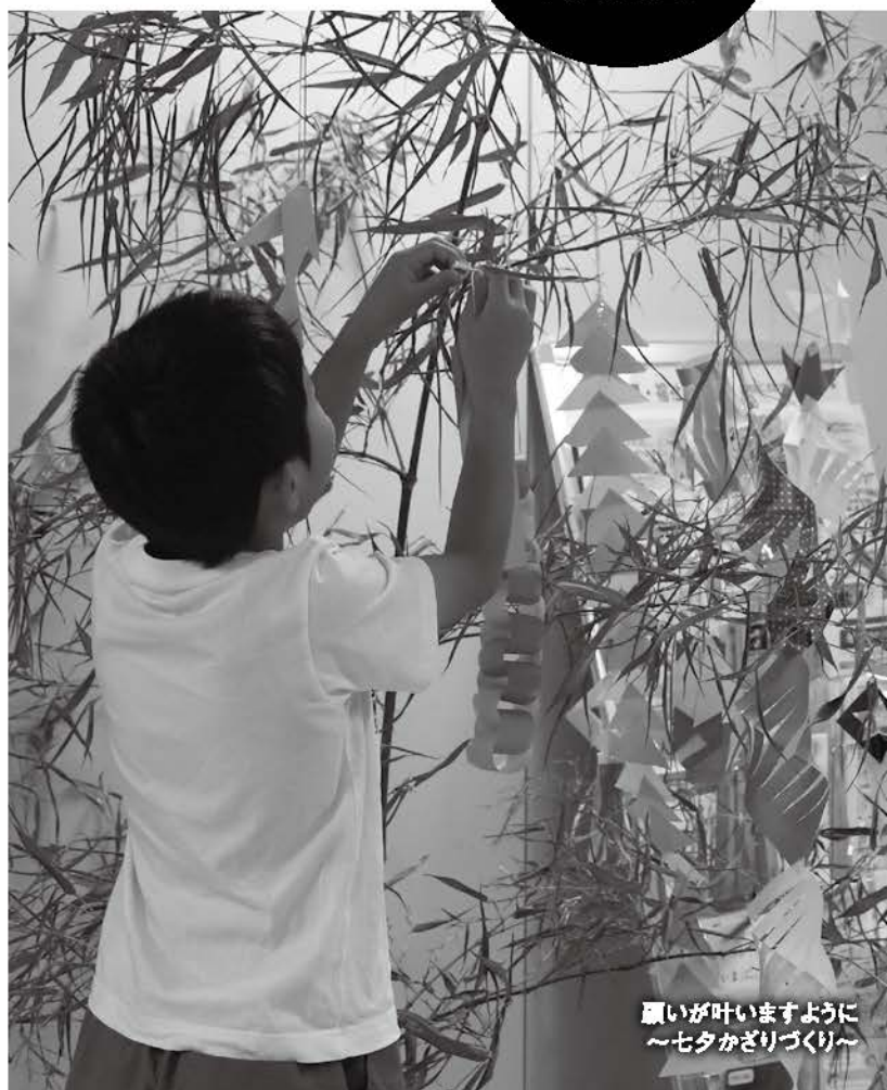
願いが叶いますように ～七夕かざりづくり～