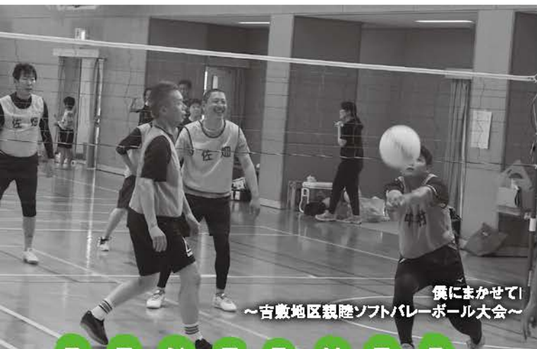
僕にまかせて！ ～吉敷地区親睦ソフトバレーボール大会～