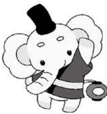
山口市健康づくり推進キャラクター けんぞう