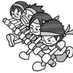
↑台風の日 イメージ画像

【開催地変更】ソフトボール(維新百年記念公園・球技場及び鴻南中グラウンド)、卓球(維新百年記念公園・レクチャールーム)